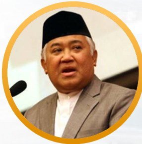
Prof. Dr. M. Din Syamsuddin, MA

Wakil Ketua Majelis Permusyawaratan Rakyat Periode 2019-2024